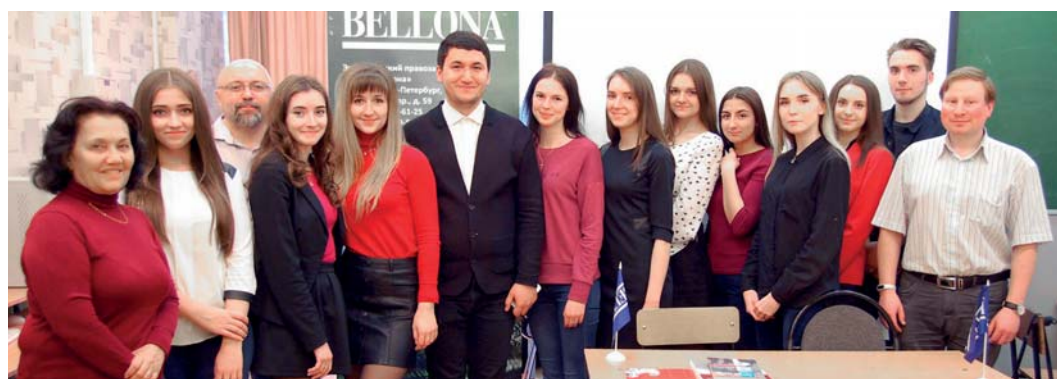
Участники семинара в Брянске 19-20 апреля 2018 года, Брянский государственный университет им. И. Г. Петровского

С 2013 года для студентов, участвующих в конкурсе «ЭКО-ЮРИСТ» и показавших хорошие результаты, организуются семинары по экологическому праву. Студенты знакомятся с методикой анализа законодательства и практикой защиты экологических прав граждан.